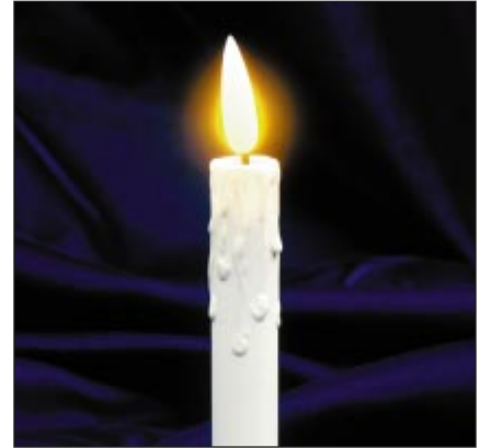
Auf der Bühne oder sogar vor der Kamera sind Flackerkerzen kaum vom Original zu unterscheiden.

Mit dem 10 cm grossen Basis-Kerzenmodul lassen sich auf einfache Art und Weise eigene Leuchter konstruieren. Der Anschluss erfolgt über 12,7 mm lange Stifte.